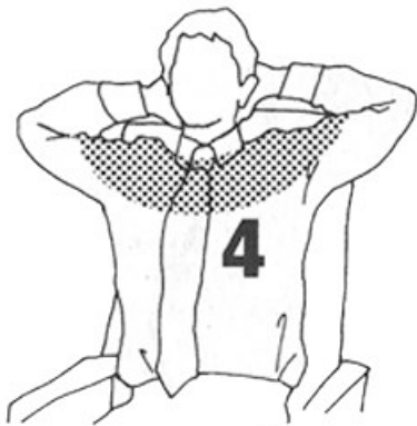
3-5 segundos (p. 91)