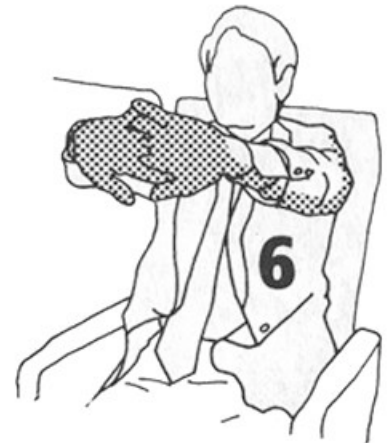
10 segundos (p. 90)