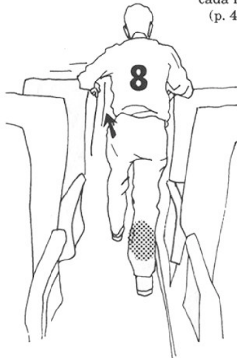
10-12 segundos cada pierna (p. 71)