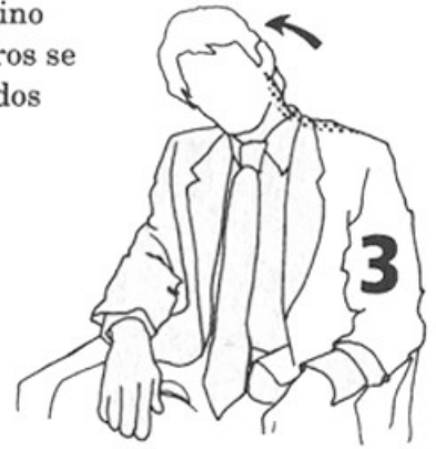
3-5 segundos cada lado (p. 46)