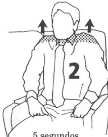
5 segundos dos veces (p. 46)