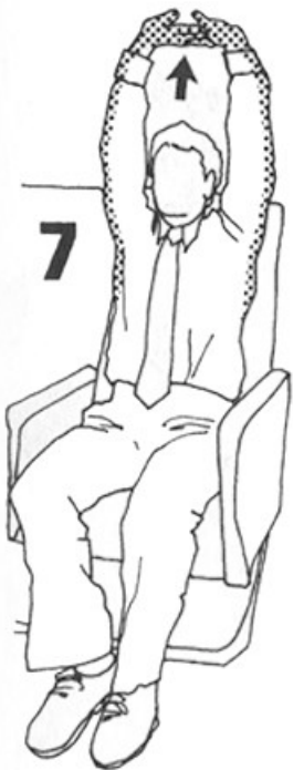
8-10 segundos (p. 90)