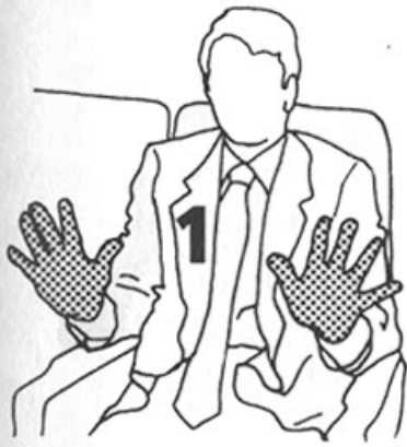
10 segundos dos veces (p. 88)

Aconsejamos fotocopiar esta página para realizar los ejercicios durante los viajes en avión. Estirar en el avión alivia la tensión y la rigidez, y permite llegar al destino en un estado de mayor relajación. No será una sorpresa que el resto de pasajeros se unan si ven a alguien realizar estos ejercicios, que están especialmente indicados para practicarse momentos antes de aterrizar.